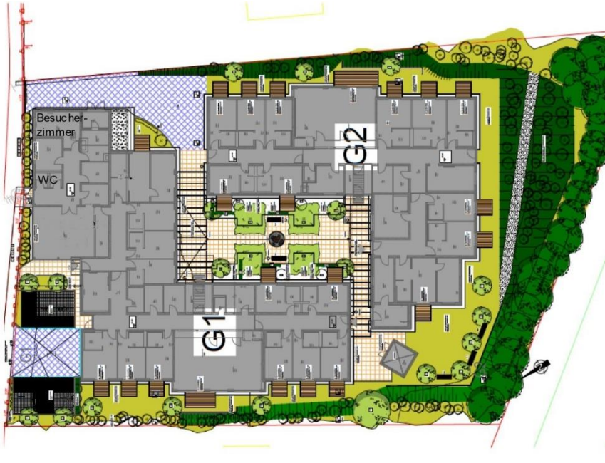
Wohnangebot in der Straubinger Str. 5, 94327 Bogen